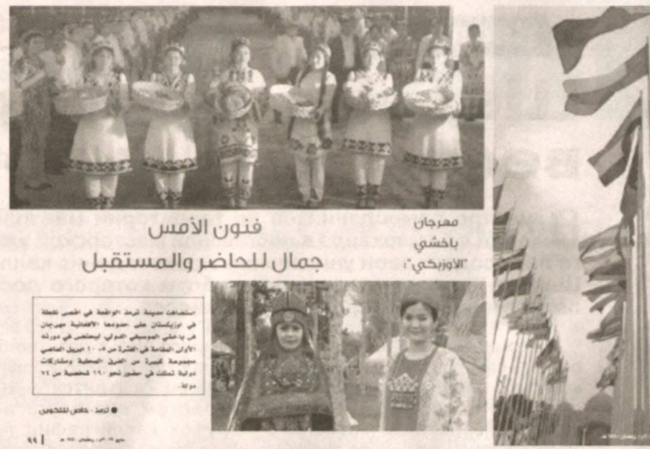
Искусство и указал на роль нынешнего фестиваля в сохранении ценностей бахши. Авторы статьи также рассказывают своим читателям о том, что в рамках мероприятия была организована международная научно-практическая конферен-

государства подверг критике попытки снизить внимание к фольклорному искусству, заявив, что сегодня, в эпоху глобализации, когда шоу-бизнес и «массовая культура», превратившись в сферу коммерции, зачастую негативно влияют на духовное развитие общества, как итог, ослабевают внимание и интерес к фольклорному искусству — животворящему источнику любой национальной культуры», — пишут оманские журналисты. Подчеркивается, что Президент Узбекистана призвал беречь и пропагандировать данный вид