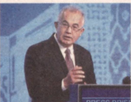
Совых институтов — все это направлено на обеспечение благополучия нашего народа, каждого гражданина страны.

это взаимное доверие между государствами ШОС, взаимная выгода, равноправие и взаимные консультации, признание культурного разнообразия, желание развиваться вместе. За 18 лет ШОС приняла более 1 400 документов, некоторые из них по инициативе Узбекистана. ШОС превратилась в организацию, занявшую достойное место в современных международных отношениях. Выступление Президента нашей страны на саммите Совещания по взаимодействию и мерам доверия в Азии, прошедшем в Душанбе, вызвало большой интерес. Фундаментом реализуемой главой нашего государства внешней политики являются царящие в Узбекистане мир и стабильность. Будь то привлечение экономических инвестиций, новых технологий, сближение с соседними государствами или поддержка международных и зарубежных финан-