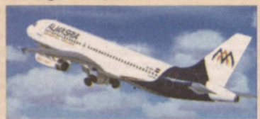
лению Ташкент — Шарм-эль-Шейх осуществляются еженедельно в среду.

Раньше, чтобы слетать из Узбекистана в Египет и обратно, требовалось покупать билеты на самолет с пересадками. Теперь прямые рейсы по направ-