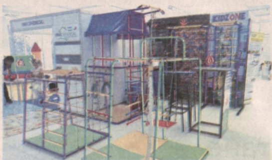
Реклама и объявления

создание условий для гармоничного развития подрастающего поколения. Данная выставка направлена в