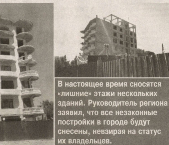
В настоящее время сносятся «лишние» этажи нескольких зданий. Руководитель региона заявил, что все незаконные постройки в городе будут снесены, невзирая на статус их владельцев.

Главный архитектор области также отметил, что разработано специальное положение, соглас-