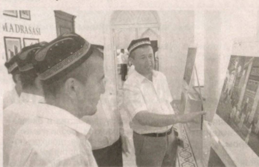
В экспозиции нашли отражение рукописные экземпляры созданного выдающимся ученым-теологом труда «Сахих аль-Бухари», вошедшего

В международном научно-исследовательском центре Имама Бухари в Самаркандской области открылась выставка, приуроченная к дню рождения этого величайшего богослова и просветителя.