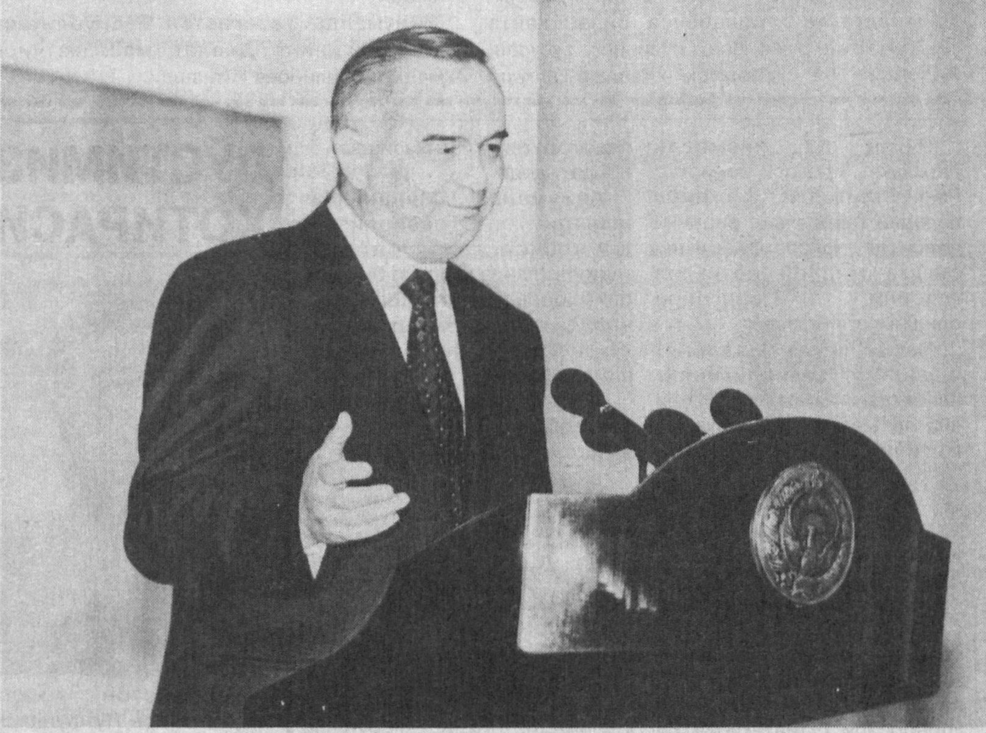
Ўзбекистон Президенти Ислам Каримов XXI асрнинг биринчи йилини мамлакатимизда оналар ва болалар йили деб эълон қилди. «Бунинг амалии маъносини шундан иборатки,