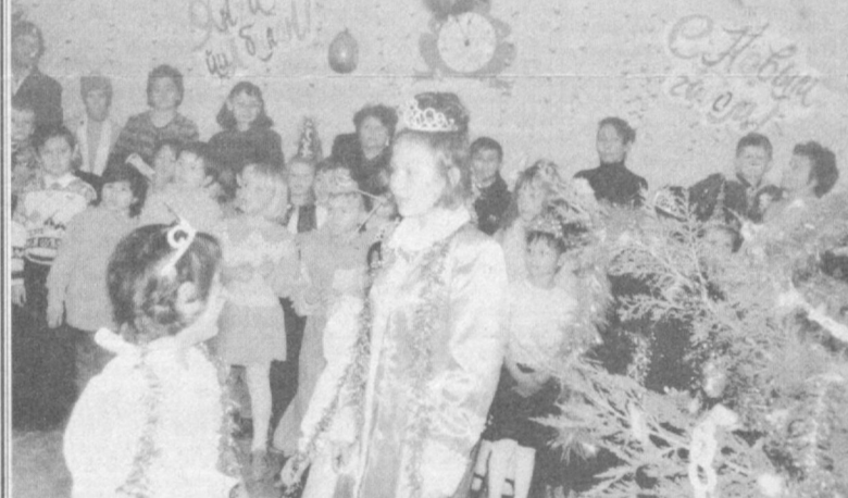
Дар суратҳо: лаҳзаҳои тантанаҳои соли нави дар шаҳри Тошқанд.

Афқору ақоиди фалсафию иҷтимоии нимасотири ва нимтаърихи кулли динҳо далолат медиҳанд, ки олам дар ибтидо аз Нур таркиб ёфтааст. Олам дар оғуши Нур, нур дар оғуши олам буд. Аллома Абдулфатх Муҳаммад бини Абдулқарим Шайхистонӣ дар китоби хеш «Миллал ванниҳал» чунин ривоят мекунад: