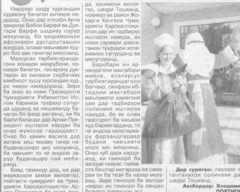
Дар суратҳо: лаҳзаҳои тантанаҳои соли нави дар шаҳри Тошқанд.