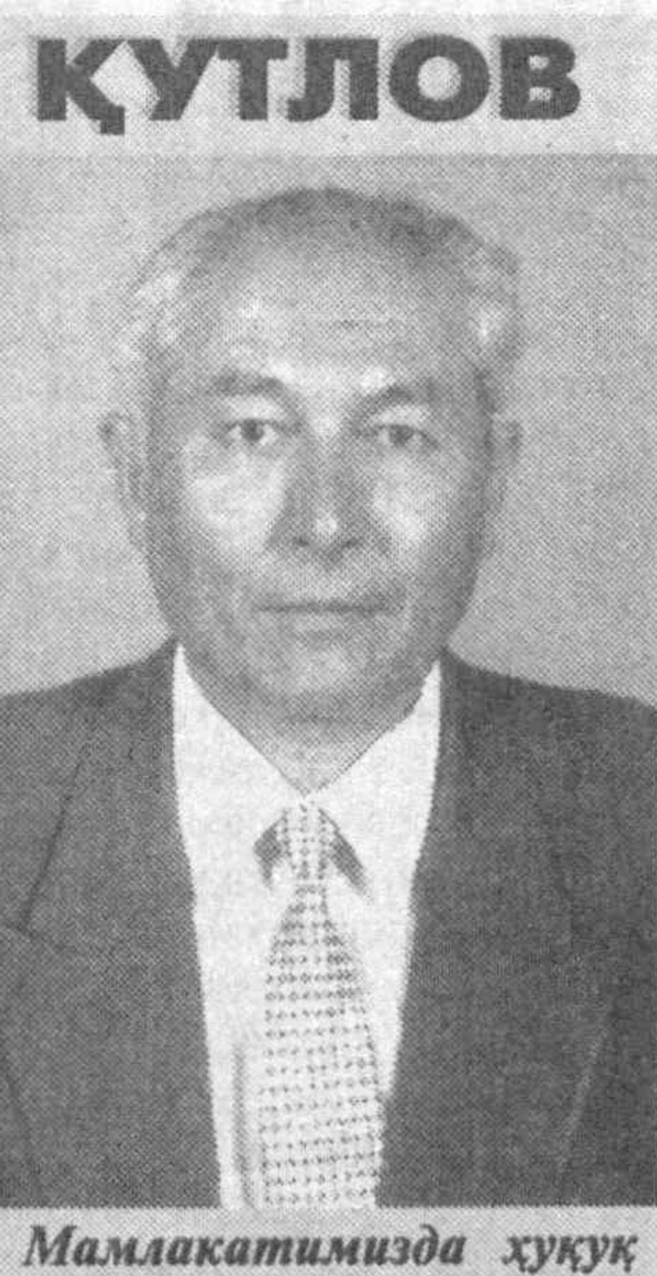
Мамлакатимизда ҳуқуқ илмини ривожлантириш ва ҳуқуқшунос кадрлар тайёрлаш борасида гап кетганда кўччилик шкоти...