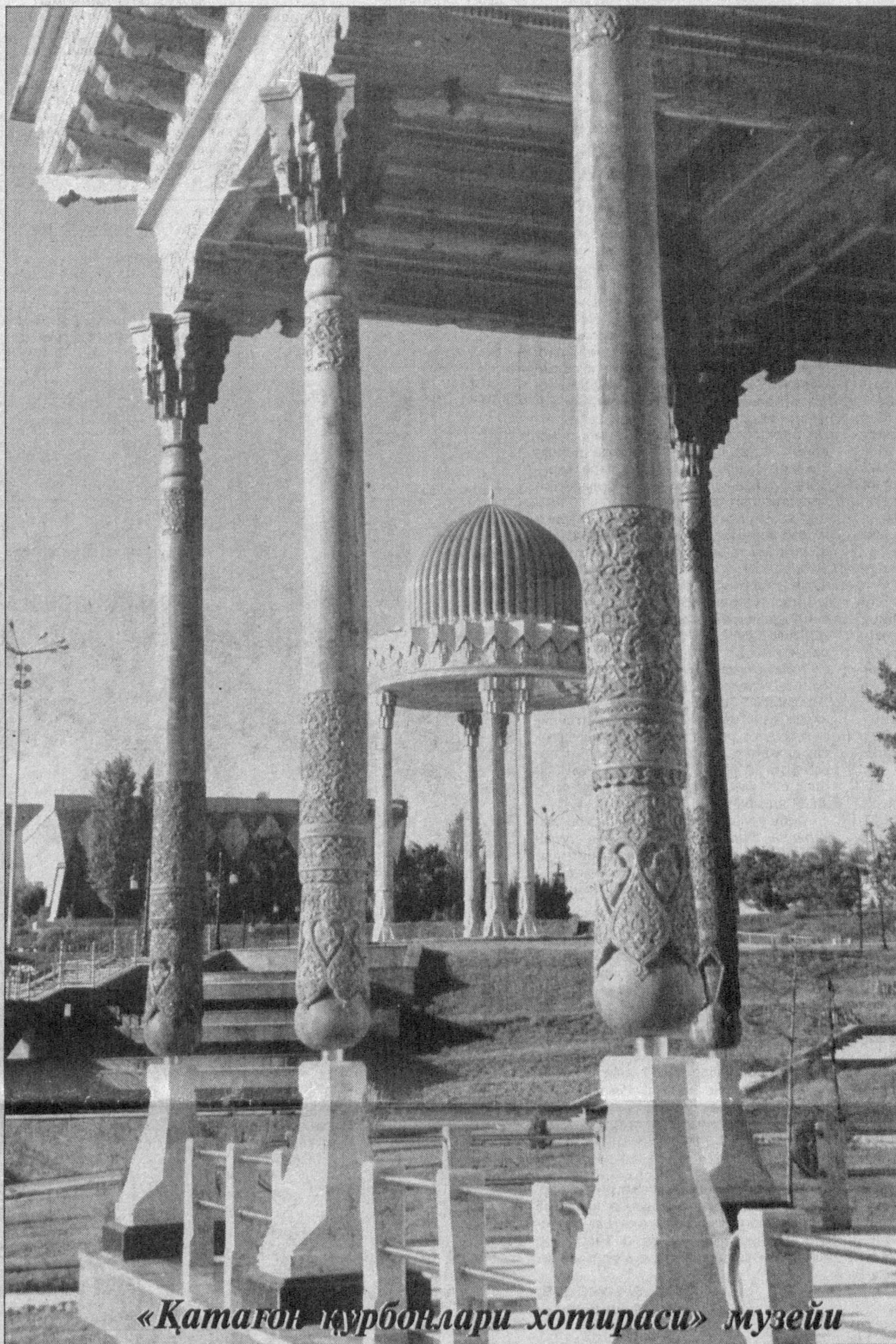
«Қатагон қурбонлари хотираси» музейи