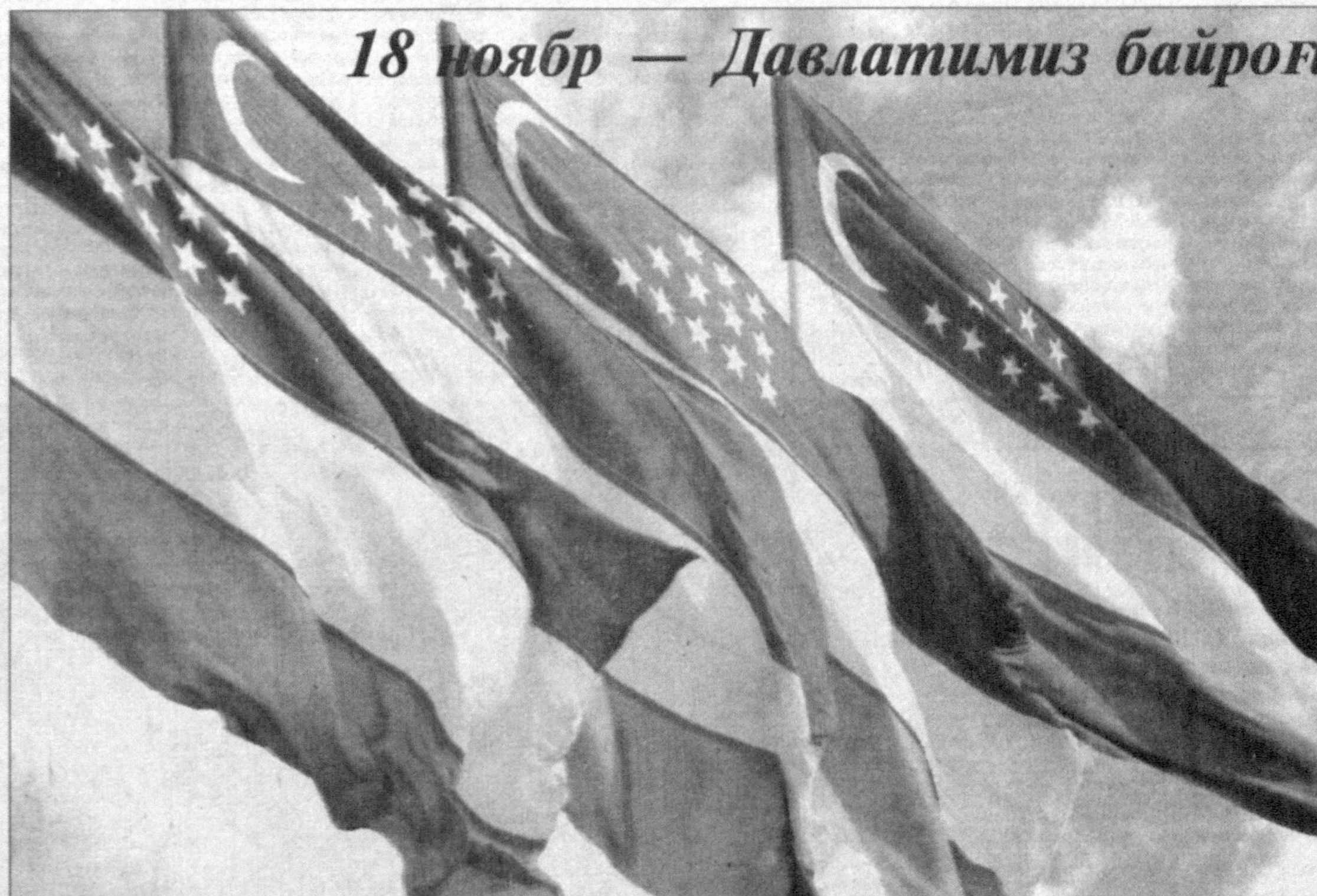
18 ноябр — Давлатимиз байроғи қабул қилинган кун

Давлатимиз раҳбари Ислам Каримов янги тузилган сиёсий партия ташаббус гуруҳи аъзолари билан учрашув чоғида таъкидлаганидек, ҳар бир партия ва ижтимоий ҳаракатнинг пайдо бўлиши, авваламбор, шу юрт ҳаётида содир бўлаётган ўзгариш ва янгиланишлар, аҳолининг, ижтимоий-сиёсий гуруҳ ва қатламларнинг ҳоҳиш-иродаси, интилишлари билан чамбарчас боғлиқдир. Шу нуқтаи назардан Тадбиркорлар ва ишбилармонлар ҳаракати, дея аталаётган янги сиёсий партиянинг фаолият бошлаётганини юртимизда босқичма-босқич давом этаётган эркинлаштириш жараёнлари ва иқтисодий ислохотлар самарали ўлароқ тадбиркорларнинг яхлит бир қатлами пайдо бўлиши билан изоҳлаш мумкин.