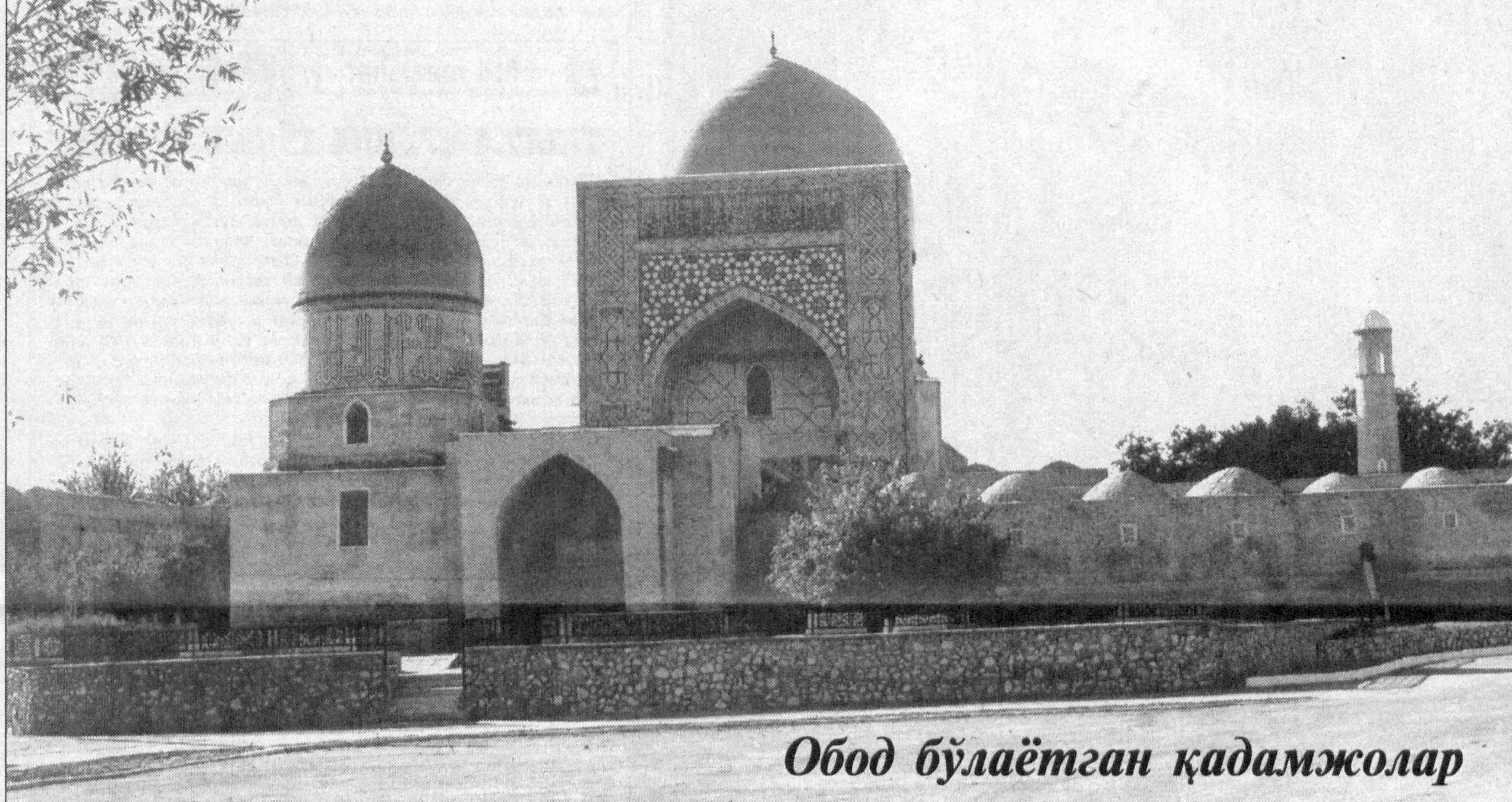
Обод бўлаётган қадамжолар