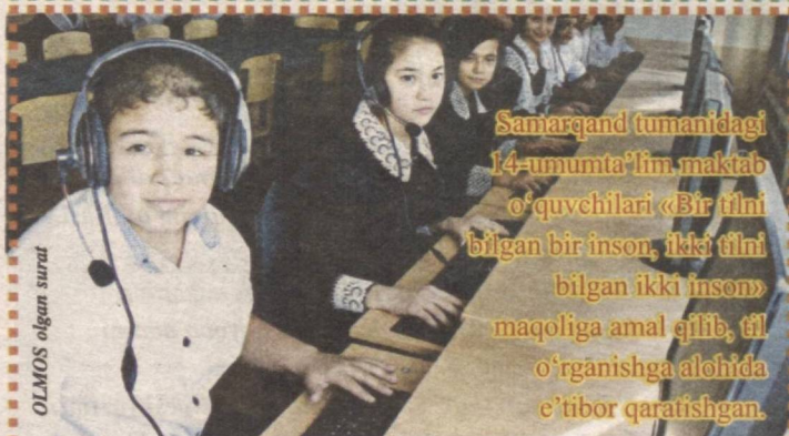
OLMOS olgan surat

Samarqand tumanidagi 14-umumta'lim maktab o'quvchilari «Bir tilni bilgan bir inson, ikki tilni bilgan ikki inson» maqoliga amal qilib, til o'rganishga alohida e'tibor qaratishgan.