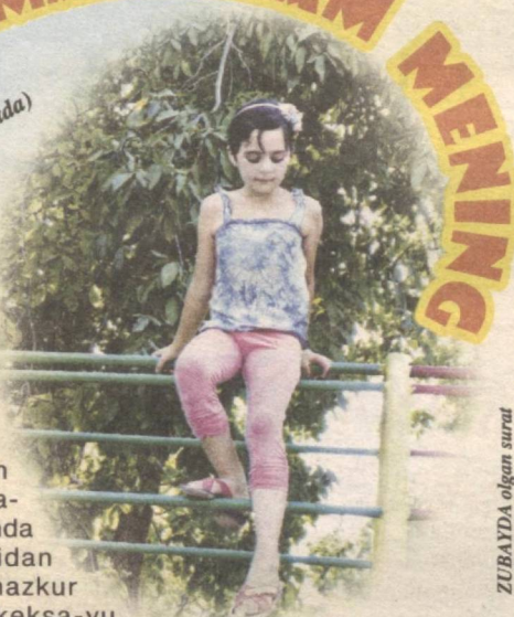
ZUBAYDA olgan surat

Yaqinda poytaxtimizning Ko'kcha dahasidagi «Oqlon» mahallasida qad rostlagan «Oqlon» sport majmuasi mahalla ahliga bayram tuhfasini bo'ldi. Mahalla faollari hamda homiylar tomonidan barpo etilgan mazkur maydoncha kekxa-yu yoshni o'z bag'riga chorlamoqda. Ayniqsa, bolajonlarga juda manzur bo'lmoqda. Yaqin kunlarda futbol ishqibozlari uchun sport to'garagi ham tashkil etish rejalashtirilyapti. Maydonchada bog' barpo qilish maqsadida ekilgan nihollar ko'kka bo'y cho'zmoqda. Dam oluvchilarga orom bag'ishlash niyatida qurilayotgan favvoralar ham