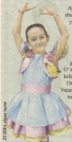
ZUHRA olgan surat

Ayniqsa, mendek jajji qizaloq uchun shunday ulug' bayramda qatnashish yuksak sharaf, deb bilaman. Bayram dasturida baxtiyor bolalik, ta'til, maktab, Vatan haqidagi qo'shiqlar uchun sahnalashtirilgan raqslarni ijro etamiz. Qo'shiqlarda kuylanganidek chindan ham biz mustaqil O'zbekistonning baxtli bolalari, kelajagimiz!