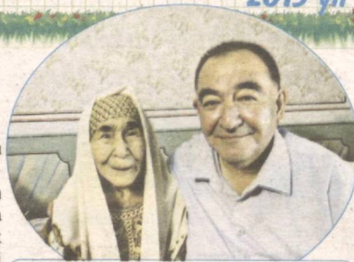
– Hayotda nimagaki erishgan bo'lsam, volidamning duolari tufayli, – deydi qahramonimiz.

Kuni kecha matbuotda ustoz davlatimizning yuksak mukofotiga sazovor bo'lganlarini o'qib, u kishini qutlashga oshiqdik. Suhbatimiz chog'ida «Siz ilgari O'zbekiston Milliy universiteti, Toshkent Islom universiteti kabi oliy o'quv yurtlarida talabalarga saboq bergansiz. Nega yana