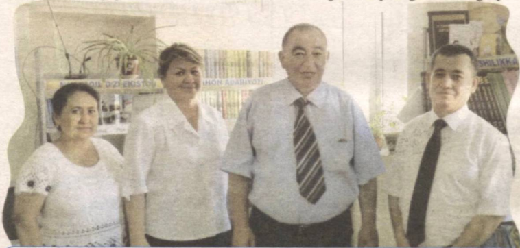
– Hamkasbimiz quvonchiga sherikmiz, – deyishadi 40-maktab o'qituvchilari.

O'zbekiston «Save the children» («Bolalarni asraylik») Xalqaro tashkiloti tomonidan tuzilgan jahon reytingida bolalar salomatligini mustahkamlash borasida katta g'amxo'rlik ko'rsatilayotgan eng ilg'or yetakchi o'n mamlakat qatoriga kiritildi.