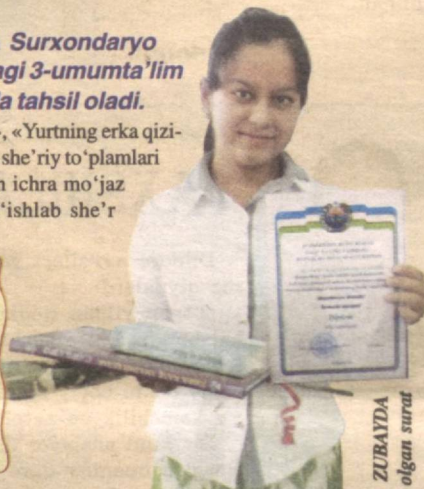
ZUBAYDA olgan surat

Istiqloldan olding nur, Bo'lding ozod, erkin, hur. Noming dunyoga mashhur, Jonajonim Termizim.