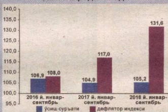
Январь – сентябрда ЯИМнинг физик ҳажми ва дефлятори индекслари динамикаси куйидаги маълумотлар билан ифодаланади

кўрсаткич ўтган йилнинг мос даврига нисбатан 3,5 фоизга юқоридир.