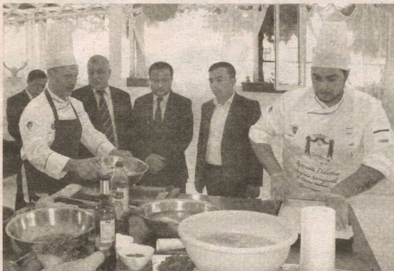
(Давоми. Бошланиши 1-бетда).

2015–2018 йиллар давомида банк томонидан агрофирмаларга 31,3 млрд. сўм, аҳолига хонадонда қуён боқиш учун 3,6 млрд. сўм миқдорда кредит маблағлари ажратилган. Ҳозирги кунда мазкур агрофирмаларда боқилаётган қуёнлар сони 132 минг бошдан ортиб, тез орада қуёнчилик соҳаси мамлакатнинг гўшт ва мўйна ишлаб чиқариш соҳаларида муносиб ўрин эгаллаши кутилмоқда.