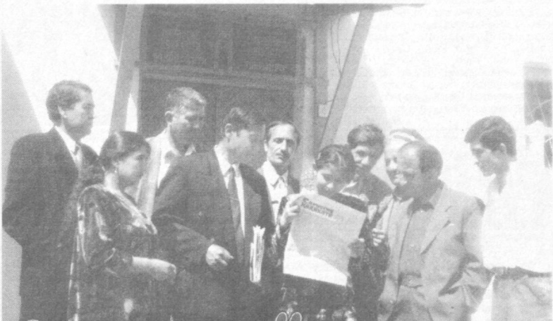
Ойнаи ҳаёти ноҳия