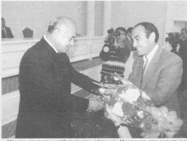
Мехнати кормандони матбуот ва воситаҳои ахбори оммавийи Узбекистон аз тарафи роҳбарияти ҷумҳурият нуносӣ тақдир карда мешавад...