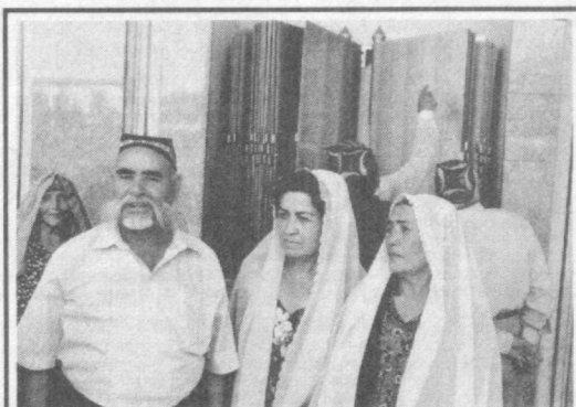
Бо пешвози рўзи истиқлол