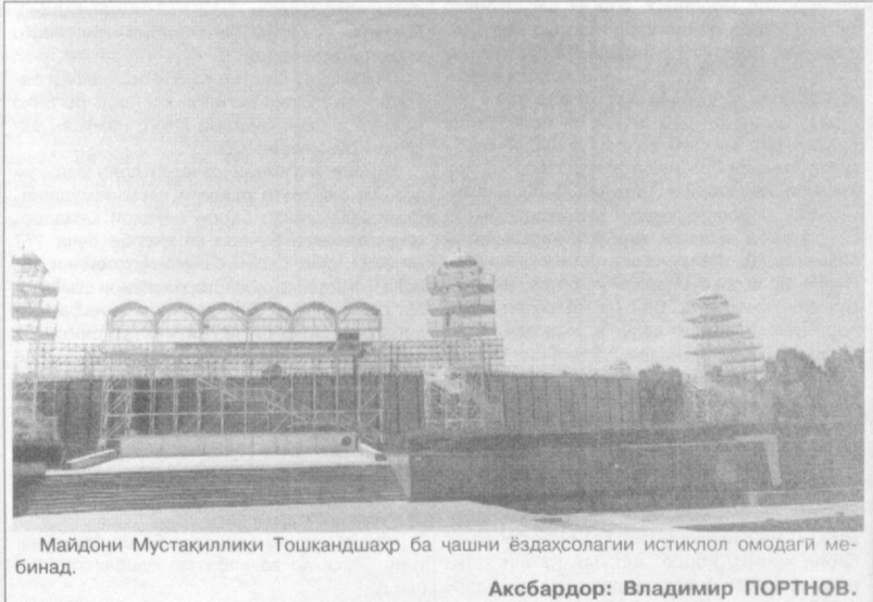
Майдони Мустақиллики Тошқандшаҳр ба ҷашни ёздаҳсолагии истиқлол омодағи мебинанд.

мебошад, тамоми фондаи саҳми худ—260 ҳазор сўмро ба ҳисобораҳои сохтмони маҷмўаи чавонон гузаронд. Нурониён дар саҳро МИНГБУЛОҚ. Дар пахтазори ноҳия мубориза барои ҳосили фаровон рўз то рўз авч мегардад. Бо ташаббуси ҳазинаи «Нурониён»-и ноҳия иборат аз мўйсифедони сохибҷабриба гурўҳи «Мададкор» ба пахтакорон ташкил ёфтааст. Аъзоёни гурўҳ, ки асосан собиқадорони меҳнат—шаҳсонӣ муқаддам дар соҳаи кишоварзӣ, дар вазифаҳои маъсул меҳнат кардагон, бо навабт ба хоҷағиҳои ноҳия баромада онди парвариши ниҳолҳои пахта намунанвор ташкил шудааст. Бахусус, парвариши гўза дар хоҷағиҳои ширкатии «Намангон», «Истикбол», «Хоразм» ва «Игитан» мувофиқи талаби рўз ба роҳ монда шудааст. Аъзои фаъоли гурўҳи «Мададкор», мўйсифеди ботанҷиба Ҷўрабӣ Нишоннов аз ҷониби ҳазинаи «Нурониён»-и ноҳия бо даҳ ҳазор сўм маблағи пулӣ мукоротинода шуд. А.НУРИДИНОВ.