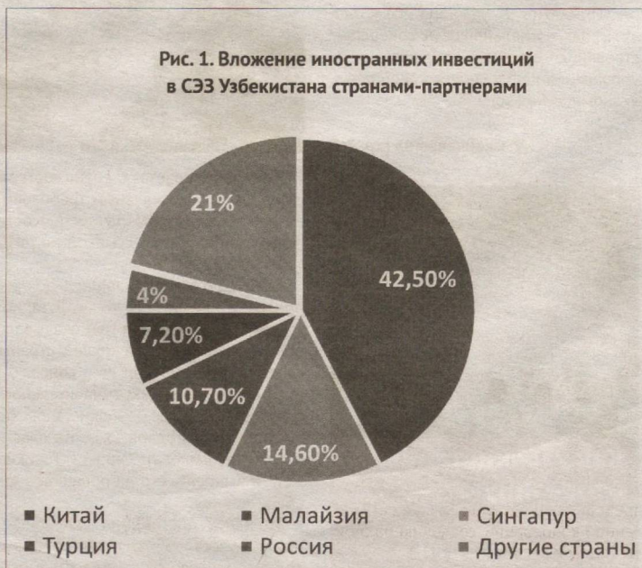
Рис. 1. Вложение иностранных инвестиций в СЭЗ Узбекистана странами-партнерами

Источник: составлено по данным Минэкономпром РУ.