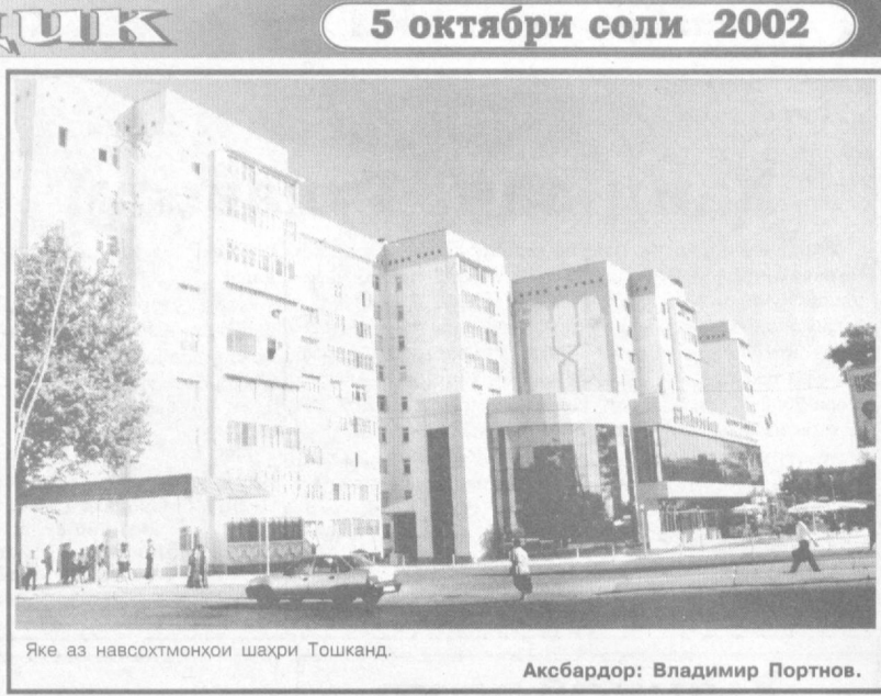
Яке аз навохотмонҳои шаҳри Тошканд.

Узбекистон II 8.55 Эълони намоишҳо. 9.00 Давр. 9.15 Почтаи «Авлоди нав».