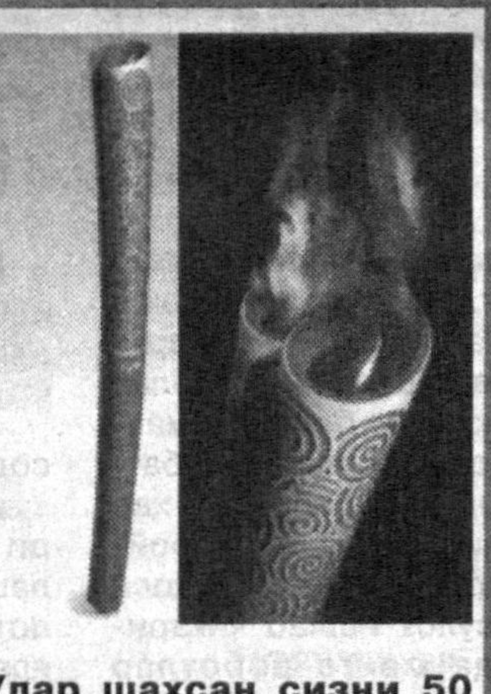
— Улар шаҳсан сизни 50 ёшга тўлишингиз арафасида ажойиб тўхфа билан хушнуд этишди.

— Алпинизм, сайёрамизнинг энг юқори чўққиларини забт этиш, ҳойнаҳой, ҳеч қачон Олимпиада ўйинлари турлари рўйхатига киритилмас керак?! — Нимасини айтасиз! Хитой алпинистлари ана шу ҳаракатни бошлашга муваффақ бўлдилар. Бунинг учун уларга катта раҳмат. Бунинг ортида беқиёс мардондор меҳнат, юксак хоҳиш ва ирода ётибди. — Қисқа вақт ичида бу каби баландликка кўтарилишнинг ўзи бўлмас керак?! — Албатта, бунинг учун пухта тайёрларли қўрилган, алпинистлар иқлимга мослаштирилган жиддий синаотларидан ўтишган, хул-