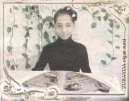
ZUBAYDA o'lgan surat

Poytaxtimizning Yunusobod tumanidagi 265-maktabning 8-«B» sinf o'quvchisi