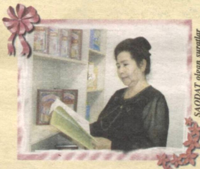
SAODAT olgan suratlardir

Quvonarli, o'quvchilarning ota-onalari, buvi-buvajonlari o'z farzandlari, nabiralari bolalar nashrlariga kelasi yil uchun obuna bo'lishni boshlab yuborishgan. O'z farzandlari ma'naviyati uchun qayg'urayotgan ota-onalarga tashakkur, degim keladi.