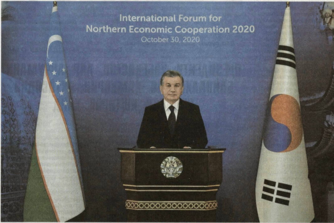
International Forum for Northern Economic Cooperation 2020 October 30, 2020

Бинобар даъвати Президенти Чумхурии Куриё Мун Чже Ин 30 октябр Президенти Чумхурии Ўзбекистон Шавкат Мирзиёев дар Анҷумани дуоими байналхалқии ҳамкори иқтисодии шимолӣ, ки дар шаҳри Сеул дар шакли конференси видеоӣ баргузор шуд, иштирок кард ва суҳанрони намуд.