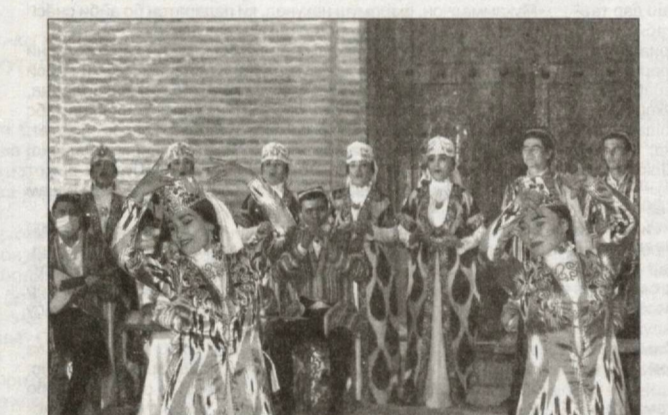
Чанде қабл дар барномаи консертӣ, ки тахти унвони «Мақом ва оҳангҳои классикӣ» аз ҷониби Ҳоҷимият ва раёсати фарҳанги вилояти Қашқадарӣ дар мачмаи «Одина»-и шаҳри Қарши ташкил дода шуд, намунаҳои «зинда»-и сурудҳои классикӣ садо доданд. Дар маросими кушоиши чорабиниҳои вилоят Зоир Мирзоев таъкид намуд, ки мероси маънавии пурбаҳо бобати тарбияи ҷавонон дар рӯҳи гиромидошти мероси ниёгон нақши муҳим дорад. Дар барномаи консертӣ оҳангҳои халқ ва сурудҳои аз қабили «Муноҷот», «Соқиномаи баёт», «Ушшоқ», «Пайдо накардам», «Дугоҳ», «Богӣ шамол», «Суратат», «Ироқи Тошканд», «Қашқадарёям» садо доданд. Дар иҷрои «зинда»-и ҳунарпешагони соҳибтаҷриба ва ҷавон савту сурудҳои классикӣ рӯҳи ҳозиринро болида сохт ва дар дили онҳо ҳисси ватанпарварӣ, меҳру оқибат ва нақӯхори бедор намуд. Дар ақс: лавҳае аз консерт.

Зан чун дарахти шикаста ҳам гашт: — Чӣ меғӯйӣ? — Илтимос, аз ягон кас як дона сигор гирифта диҳед. — Чӣ, ту фикр мекунӣ, ки ман дигар кор надорам? — Илтимос, як дона, — зорӣю тавалло кард зиндонӣ. — Барои чӣ нишастай? — Занамро куштам. — Вой, нобақор, магар одам занашро ҳам мекушад? — Вақте хиёнат мекард, ўро доштам. — Фарзанд дорӣ? — Ҳаромияш дар шикамаш мурд. — Чӣ, ҳоло зани пойгаронро куштӣ? Туро оевзанд ҳам кам аст. — Як дона сигор... — Бас кун, қотили сангдил, дигар гап назан! — Барои чӣ? Ман ўро бе-ниҳоят дӯст медоштам. (Давомаш дар сах. 7.)