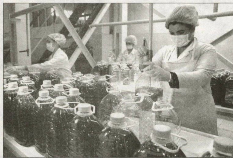
Чамъияти масъулиятш маҳдуди «Namangan Tola-Tekstil» ба коркарди ҷигити пахта махсусонда шудааст. Дар корхона миқдори ашёи хоми рӯзона 200 тоннаро ташкил менамояд...