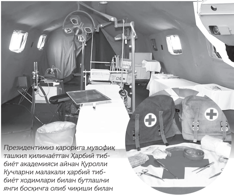
Президентимиз қарорига мувофиқ ташкил қилинаётган Ҳарбий тиббиёт академияси айнан Қуролли Кучларни малакали ҳарбий тиббиёт ходимлари билан бутлашни янги босқичга олиб чиқиши билан аҳамиятлидир.