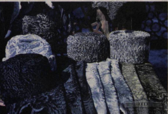
“Шувуқ таркибиде олтин борлиги тасдиқланган факт. Сур ва шобдор териларнинг тилладай товланиши, ҳақиқий Бухоро қоракўлининг доврўғиям шундан”.

Шу ўринда таъкидлаш жоиз, давлатимиз раҳбари 2018 йилда Навойи вилоятига ташрифини олис Томди туманидан бошлади. Бу 40 йиллик танаффусдан сўнг ушбу туманга мамлакат раҳбарининг илк ташрифи эди. Худуд фаоллари билан ўтказилган мулоқотда аҳолини узоқ йиллардан буйи ташвишга солиб келётган муаммолар, хусусан, чорвачиликнинг, бинобарин, чорвадор ҳамда унга боғлиқ инфратизим меҳнат-кашларининг эртаси ўртага ташланди. Чуноччи, бир пайтлар Том-