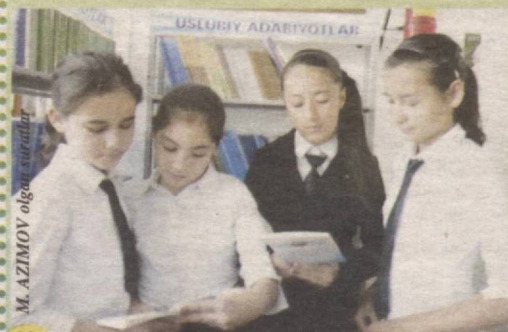
M. AZIMOV olgan suratlar