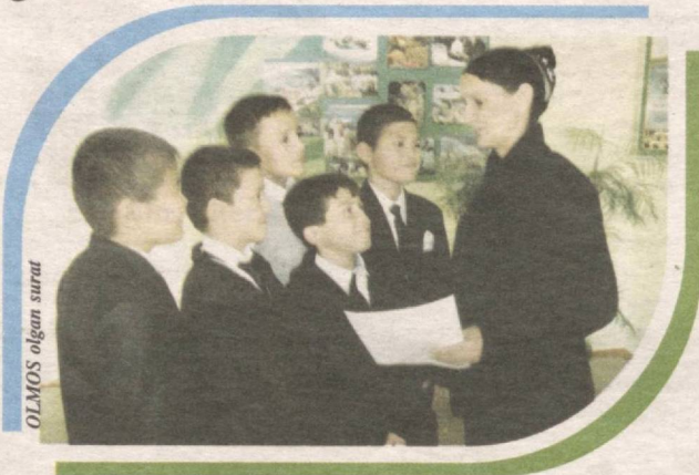
OLMOS olgan surat

Konstitutsiya (lotincha – «constitution») – tuzilish, tartib) davlatning asosiy qonuni.