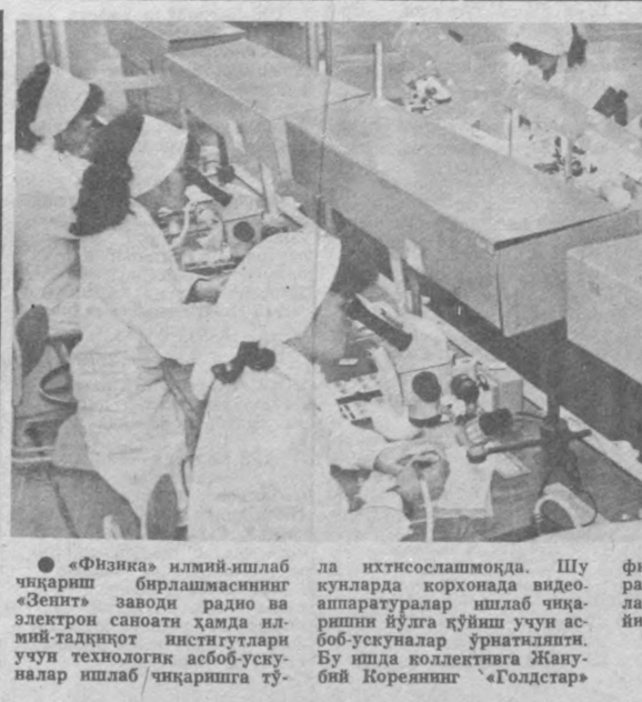
«Фавна» илмий ишлаб чиқариш бirlашмасининг «Зенит» заводи радио ва электрон саноати қўнқиш учун асвий таъини инстиутлари учун технология асбоб-ускуналар ишлаб чиқаришига тўқини...

Ўзбекистон касабасоюзлари республика Совети ушбу фондга 30 минг сўм, уни таъини этган Бутуниттифок иxtиросчилар ва рацонализаторлар жамияти обласьте кенгешини 25 минг сўм ўтказди.