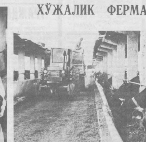
атли ўтказиш учун барча чора ва тадбирларни амалга оширмоқдалар. Суратларда: