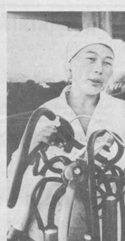
Оққўрғон ноҳиясидаги «Озод» колхоз чорвадорлари кишлоқни муваффақиятли ўтказиш учун барча чора ва тадбирларни амалга оширмоқдалар. Суратларда: