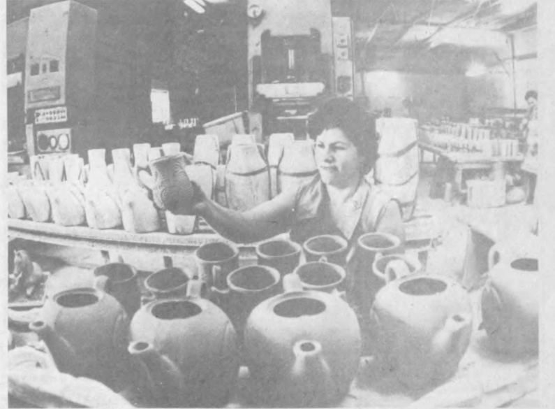
ПОЙТАХТДАГИ қурилиш материаллари комбинатида қўллаб кенг истеъмол бўялган қўра тайёрланади. Бунинг учун комбинат қўшма маҳсул цех ишлаб турибди.

Умуман бажарилмаган, ёки низоҳисига етмаган нақазларнинг борлиги уларни имкониятга қарамадан қабул қилинганлигини оқибатидир. Имконият эса шубҳасиз ижрокони ҳамнингнинг катта кичиклиги билан ўлчанади.