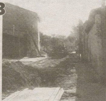
97 та назорат қудуқларининг 90 таси ўрнатилди.

Б угун юртимизда баҳолини тоза ичимлик суви билан таъминлаш борасида улкан ишлар амалга оширилмоқда. Бу борада Тошкент вилояти Пискент туманида ҳам 2019 йилда салмоқли ишлар амалга оширилди.