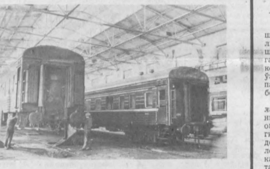
Суратларда: Карим Тешабоев (чапда) ва Исхандар Абдуқодирлар ремонт қилинган вагонлар қисмларини йиғмоқда; депода вагонлар ҳар томонлама назоратдан ўтказилди. Уларнинг электр жиҳозлари ҳам, терморез системаси ҳам тўла ремонт қилинди.