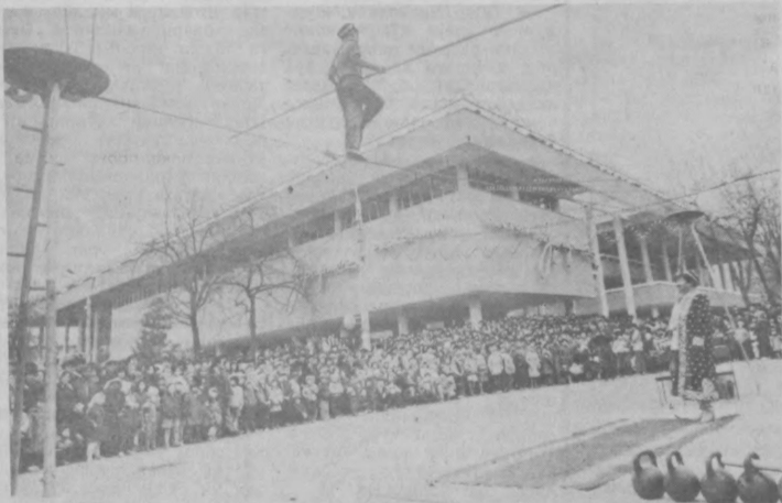
● Суратларда: Наврўз шодиёналаридан лавҳалар.