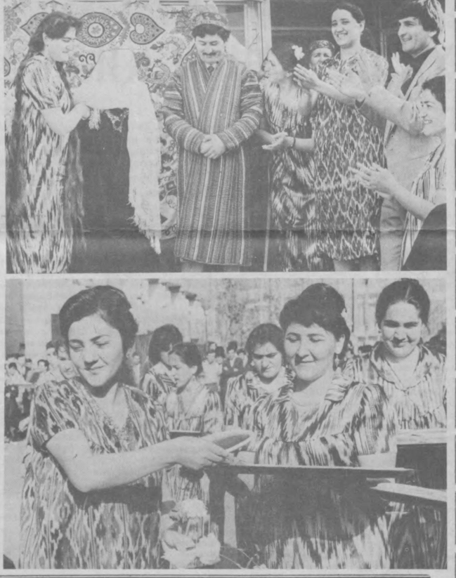
ТОЖИК ҚАРДОШЛАР БИЛАН

• Наврўз арафасида пойтахтда ҳамда вилоятнинг турли шаҳар ва ноҳияларида ана шу миллий байрамга бағишланган турли тадбирлар уюштирилди. Уларда сумалак, ҳалим ва бошқа кўнмак таомларни ҳожираб, дастурхонга тортиди. Айниқса, мазкур байрамнинг байналмилал тус олаётгани, уларнинг ташаббускорлари орасида ёшларнинг ҳам кўпайиб бораётгани қувончлидир. Яқинда Тошкент Олий партия мактабида ҳам Наврўз сайли ўтказилди. Тожикистондан келган бир гуруҳ тингловчилар ташаббус билан ўтказилган бу сайли иштирокчилар ва меҳмонлари қардошларимиз анъаналари билан танишиб, нозик дид билан безалган дастурхондаги баҳор неъматларидан татиб кўрдилар. Байрамнинг кўтарини руҳда, куй ва қўшнлар ҳам оҳанглигида ўтишида Тожикистоннинг Ленинобод вилоятидан келган «Умид» ҳамда Ўратепанинг «Тулёр» ансамбллари ҳиссаси ҳам катта бўлди. У. ҲИҚМАТОВ. • Суратларда: Наврўз сайли лавҳалари.