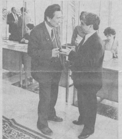
ТОШКЕНТ. Ўн иккинчи чақириқ Ўзбекистон ССР Олий Советининг биринчи сессиясида, таанафус пайти, мажлис залда. НУРИДДИНОВ