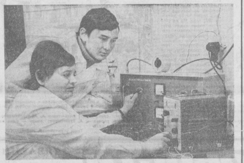
В лаборатории антикоррозийной защиты Среднеазиатского научно-исследовательского института природного газа ведутся систематический контроль состояния газопроводного оборудования...