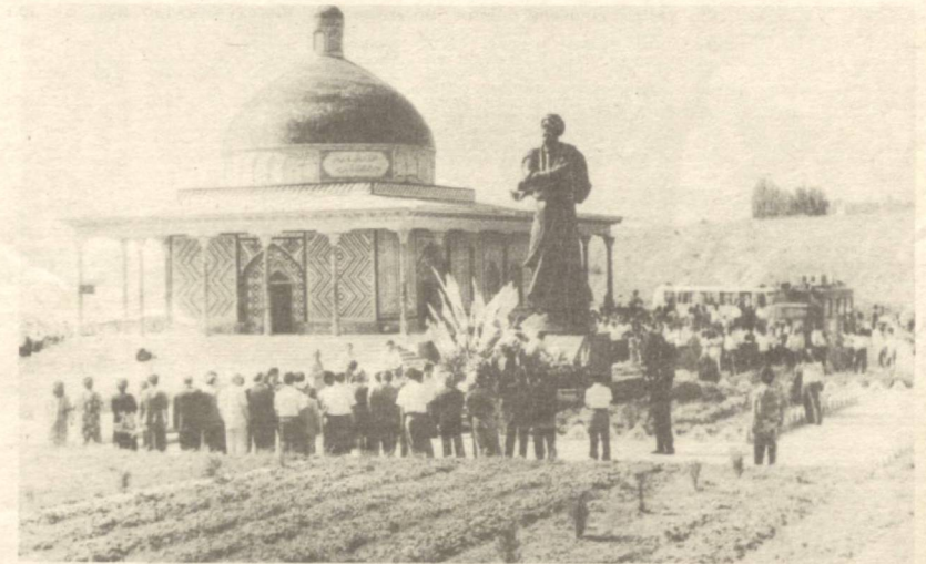
Наманган шаҳридаги Машраб ҳайкали.