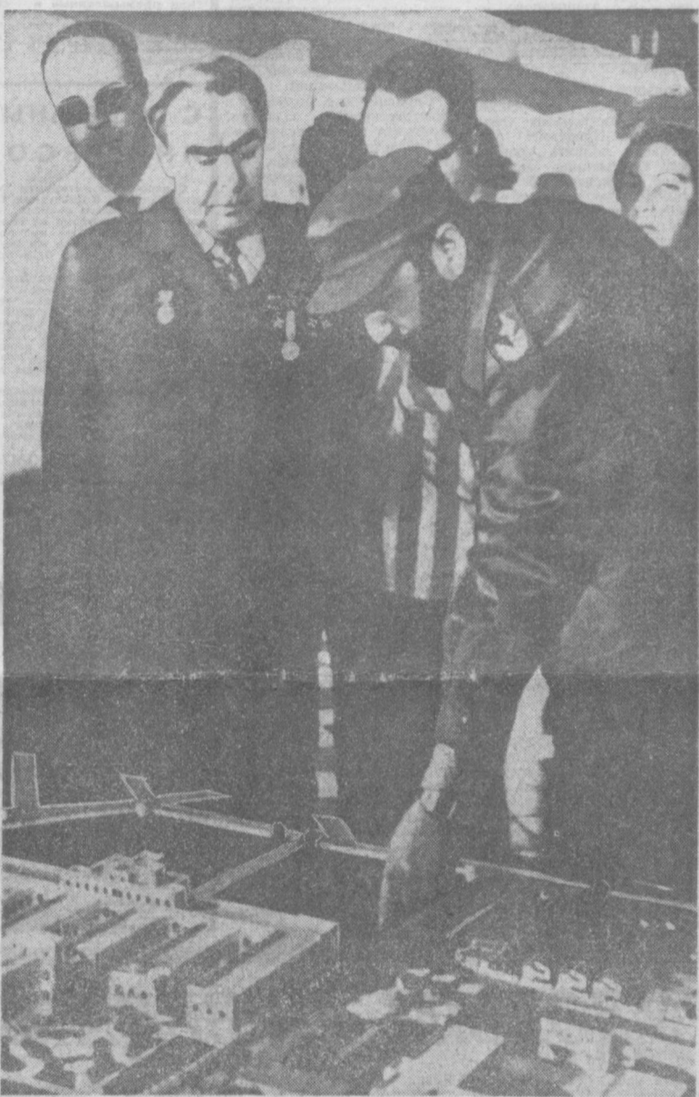
Генеральный секретарь ЦК КПСС товарищ Л. И. Брежнев, Первый секретарь ЦК Компартии Кубы, Первый секретарь ЦК Компартии Сантьяго-де-Куба, товарищ Фидель Кастро и другие советские и кубинские товарищи осматривают исторический музей «26 июля».

Женный товарищем Фиделем Кастро и другими кубинскими героями, не логично и не могло погаснуть, ибо революция отражала глубочайшие чаяния народа, его решимость покончить с гнетом «своих» и чужих эксплуататоров, перестроить жизнь на социалистических началах. Да здравствует кубинская революция, положившая начало новой эпохе в истории Кубы!