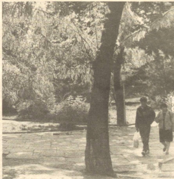
Кузак сокинлик фасли.

Азизим, ҳамма вақт мамлакат аҳволи ва халқ фаровонлиги учун зарур булган нарсаларни бунёд этиш йулида саъй-ҳаракат қилган, тиниб-тинчимган ва бундай одатни ҳаммаша ўз хотири саҳифаларига нақш этиб, марҳамат майдонида халқ бошига шафқат ва меҳрибонлик байроғини жилвалантириб, баланд кўтарган подшоҳгина ўз вазифасини адо этган булади.