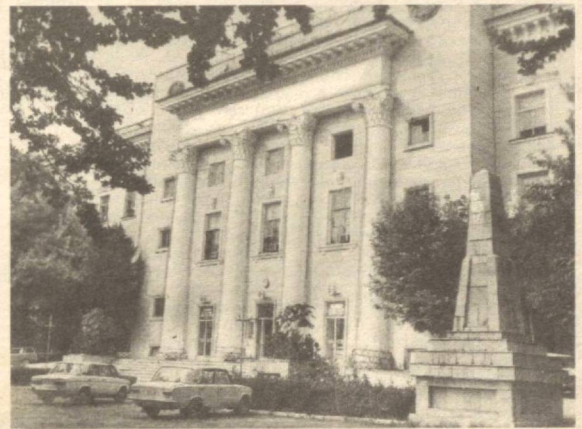
Тошкент телеграф-телефон станцияси биноси.