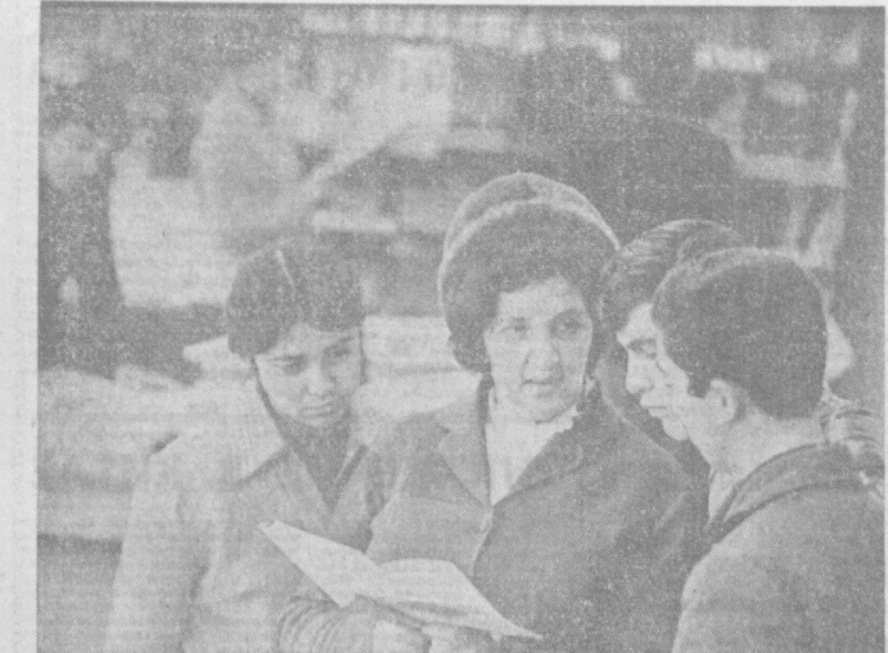
И ПРОФЕССИЮ, И ОБРАЗОВАНИЕ