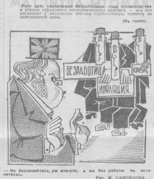
Рост цен, увеличение безработицы, спад производства и угроза серьезного экономического кризиса — все это вынуждает население Англии глубочайшую тоску за завтрашний день. (Из газет.)