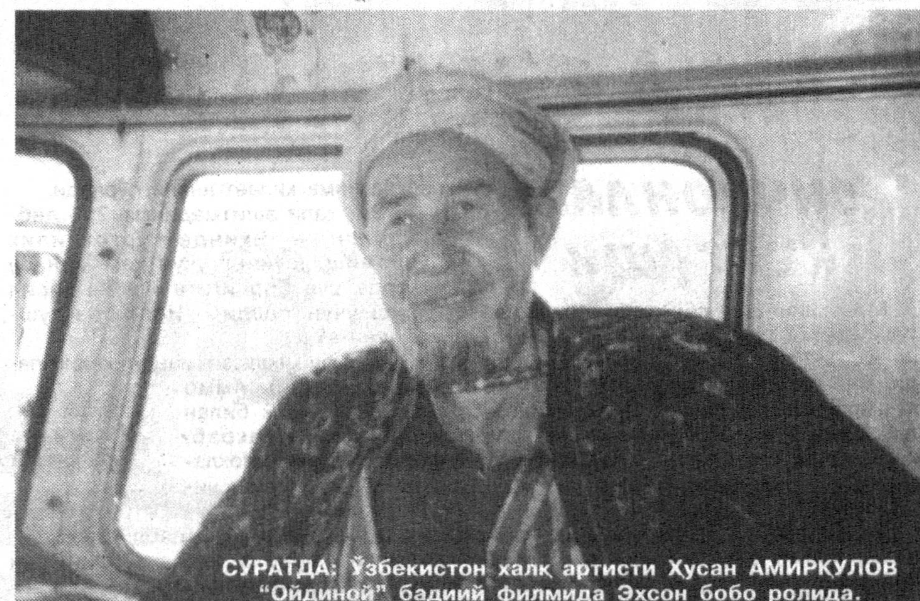
СУРАТДА: Ўзбекистон халқ артисти Хусан АМИРКУЛОВ "Ойдиной" бадий филмида Эҳсон бобо ролнида.

— Бугунги медиа таълим оммавий алоқа воситалари ёрдамида ўзининг киришувчанлик ва ижодий қобилияти, танқидий фикрини ривожлантира оладиган шахснинг тараққиёт жараёни сифатида қаралиши керак... Телевидение, ра-