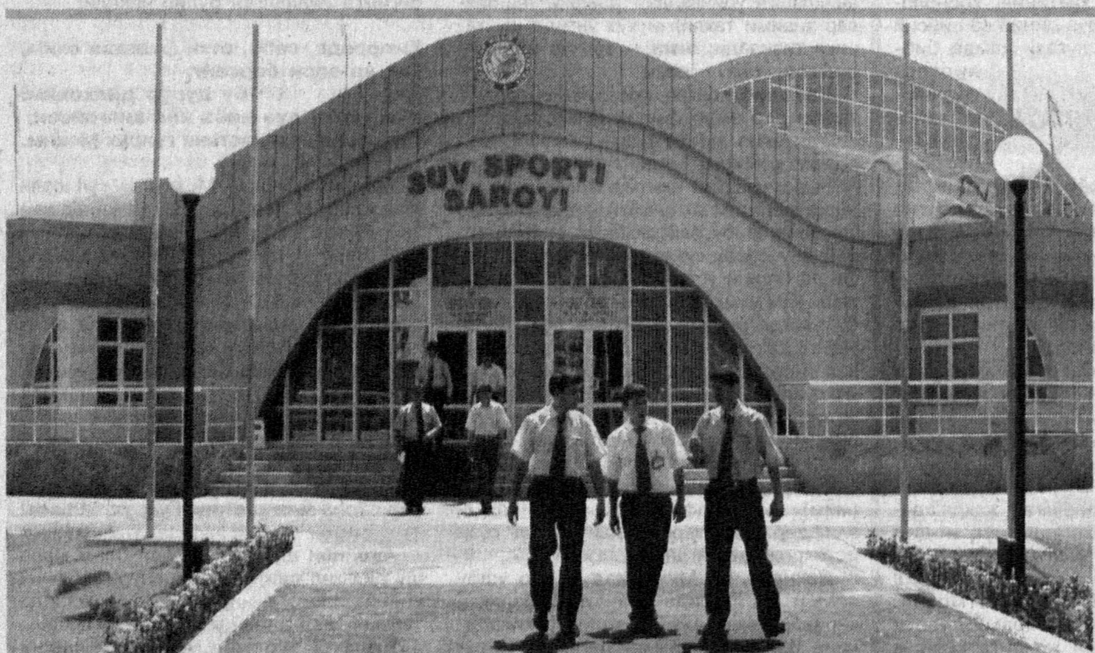
«Ёшлик» талабалар шаҳарчаси пойтахтимизнинг энг обод ва гўзал худудларидан бирига айланди.

Тошкентим, Бош кентим, Қуёш кентимсан, Минг аср ўтса ҳамки ёш кентимсан!