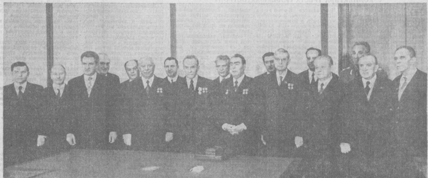
Руководители партии и правительства при вручении наград товарищу А. Н. Косыгину.

— досрочно освоить надежную проектную мощность второго энергоблока на 300 тыс. квт. В марте выйти на мощность станции 600 тыс. квт с выполнением всех проектных параметров; — годовую план строительства монтажных работ по генплану выполнить досрочно, 22 декабря, освоить сверх плана более 1 миллиона рублей, а собственными силами 26 декабря выполнять работ сверх плана на 150 тыс. рублей; — выполнить принятый встречный план к установленному годовому заданию: ввести в эксплуатацию энергетический блок № 3 мощностью 300 тыс. квтч. досрочно, 30 декабря 1974 года; — Вести в эксплуатацию: 10.656 кв. метров жилья при плане 7.924 кв. метров полезной площади; из них: общежития на 354 места — в марте, жилой дом № 6 — в мае, жилой дом № 7 — в августе, активный зал энерготехникума — в мае, служебно-бытовой корпус — в июле, химлаборатория в комплексе с центральной ремонтной мастерской — в сентябре, макузное хозяйство в комплексе — в мае, магазин на 10 рабочих мест — в мае,