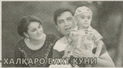
— ХАЛҚАРО БАХТ КУНИ

“ОДДИЙ одамлар бугунги кунда бўлаётган ўзгаришларни сезиши керак. Улар эртага эмас, бугун яхши яшашни истади. Уларга бугун яхши шароит яратиб беришимиз лозим. Барча амалга ошираётган ишларимиздан кўзланган мақсад-муддао халқимизнинг бахту саодатидир”. Президентимиз Шавкат Мирзиёев давлат раҳбари сифатида фаолият бошлаганидан оқибатда ана шу ҳаққоний талабни илгари сурди.