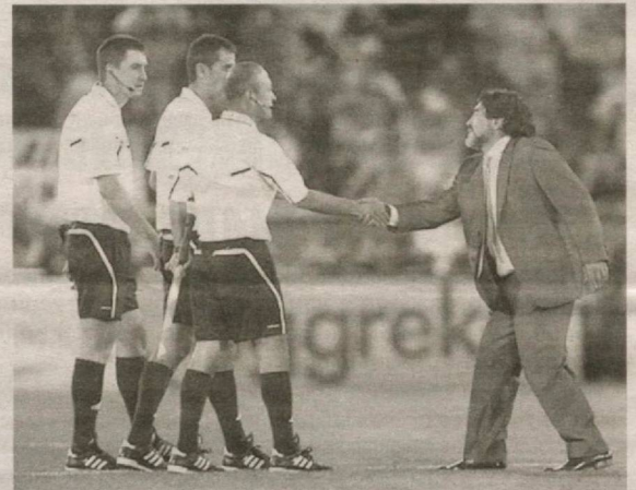
Главный тренер сборной Аргентины Диего Марадона благодарит бригаду Равшана Ирматова после матча ЧМ-2010

К тому же в Англии высокие требования к легионерам – чтобы получить право на работу, они должны провести определенный процент игр за свои национальные сборные. Там вся мировая элита выступает. Соответственно,