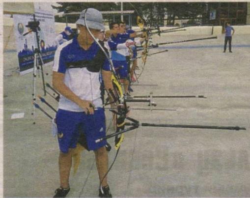
Соревнования завершатся 25 августа, когда состоятся финальные состязания.

В преддверии 29-летия государственной независимости по нескольким видам спорта проходят онлайн-соревнования «Кубка Независимости Узбекистана».