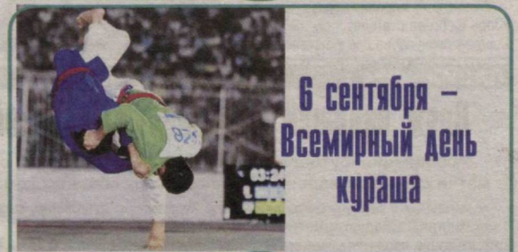
6 сентября – Всемирный день кураша