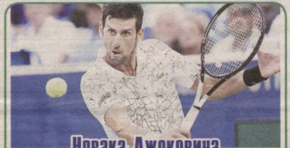
Новака Джоковича дисквалифицировали на US Open