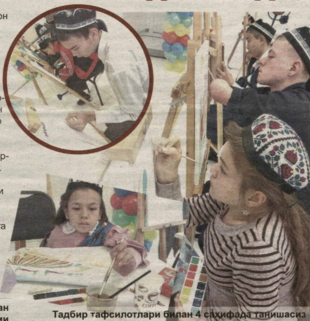
Тадбир тафсилотлари билан 4 саҳифада танишасиз

Ушбу танловнинг бошқаларидан фарқи бўлди танловда ҳеч ким иккинчи ва учинчи ўринни эгалламади. Аксинча, танловда иштирок этган болалар уларнинг имкониятлари чекланганлигига қарамасдан ҳаётга бўлган қизиқишлари юқори даражада эканлиги ва бу борада бошқаларга ўрناк бўлганликлари сабабли уларнинг барчаси 1-даражали диплом билан тақдирландилар.