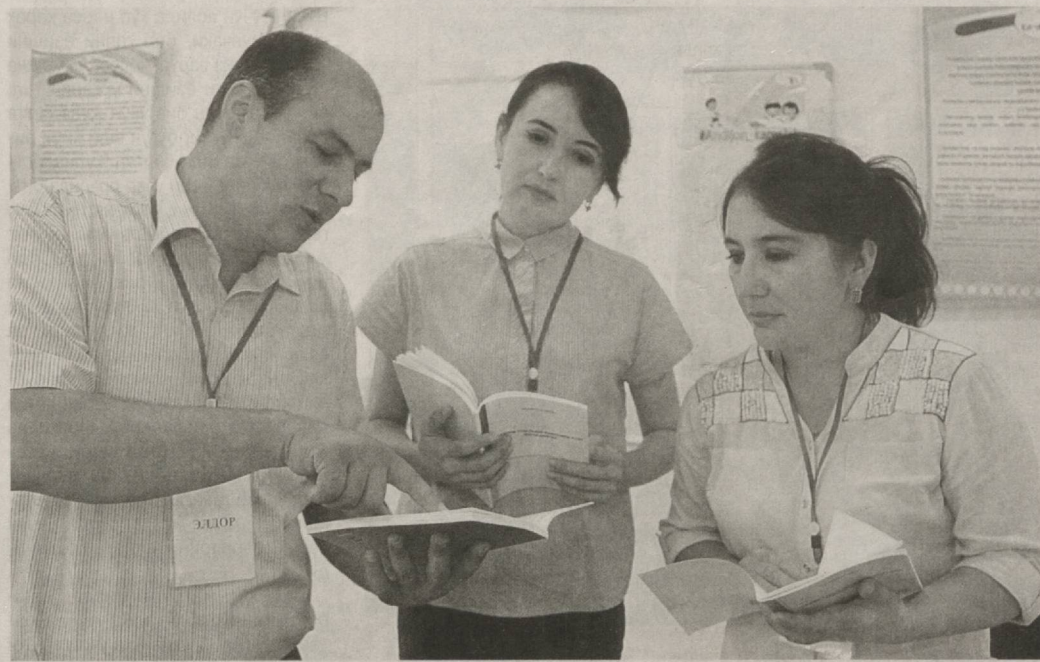
Анджон шаҳридаги вилоят Ёшлар марказида жорий йил декабрь ойида Олий Мажлис Қонунчилик палатаси, халқ депутатлари вилоят, туман ва шаҳар кенгашларига ўтказилган сайловларга тайёргарлик доирасида семинар-тренинг бўлиб ўтди.

Барча даражадаги сайлов комиссиялари аъзоларига номзодларнинг сайлов қонунчилигидаги янгиликлар, сайловларга тайёргарлик кўриш ва уларни ўтказишга оид билим ва кўникмаларини оширишга қаратилган семинар-тренинглари оdatдагидан уч ой аввал — 3 августдан бошланди. Таъкидлашим лозимки, ўқитишнинг юқоридан қуйига қараб