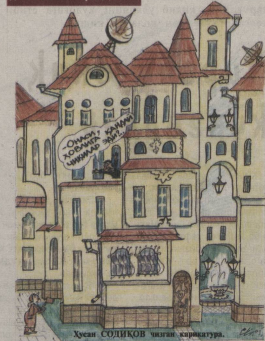
Хусан СОДИҚОВ чизган ҳаракатра.