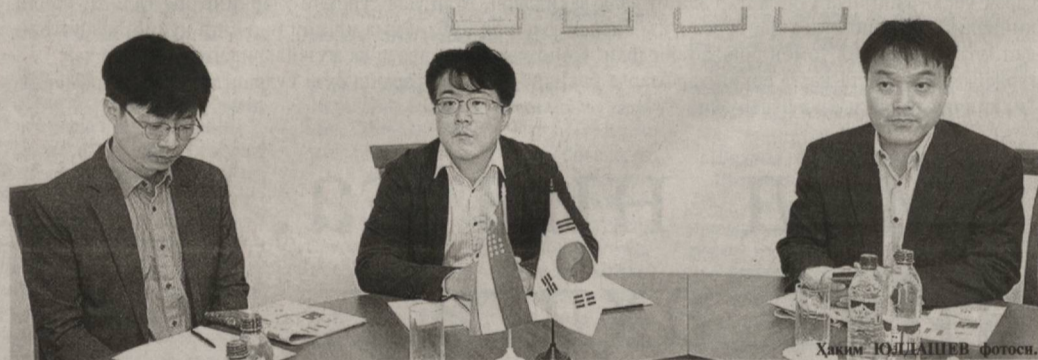
Ҳақимов Ю.САЛИМОВ фотоси.

Холмурод САЛИМОВ, Ўзбекистон Журналистлари ижодий уюшмаси раиси ўринбосари.