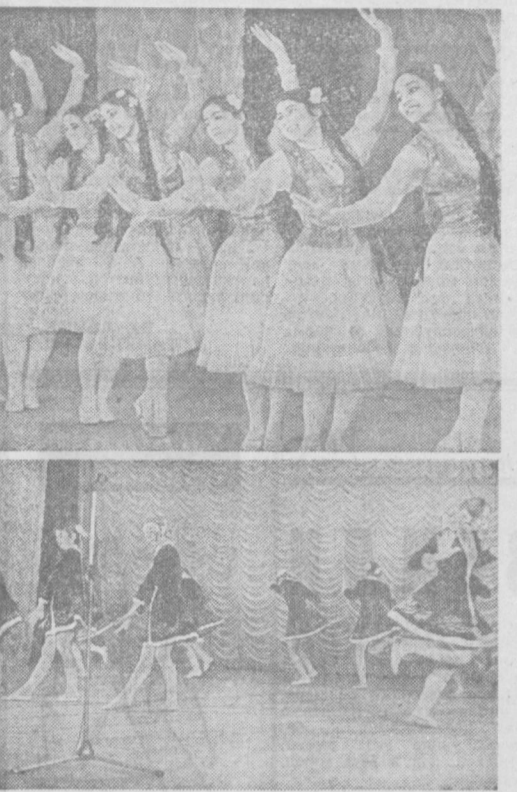
Началась неделя музыки для детей и юношества. На снимках вверху — участники Ташкентского хореографического училища исполняют узбекский танец...